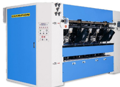
SLITTER SCORER Unidade corte/vincadora longitudinal