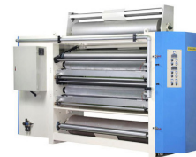
GLUE STATION Unidade de colagem dupla