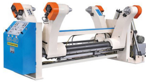
MILL ROLL STAND Unidade hidráulica de alimentação de bobine