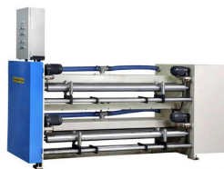
SUCTION BRAKE Módulo estabilizador de controlo da tensão