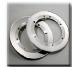
SLITTER RAZOR KNIFE