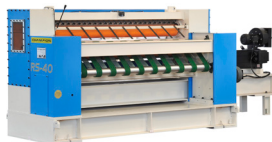
ROTARY SHEAR Unidade automática de corte transversal