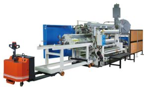
SINGLE FACER Caneladoras