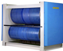
BELT DRIVE UNIT Unidade de transporte